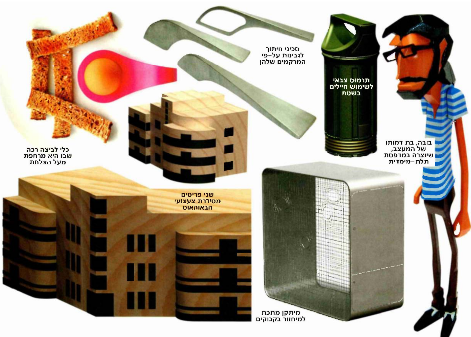
מכל לביצה רכה שבו היא מרחפת מעל הצלחת