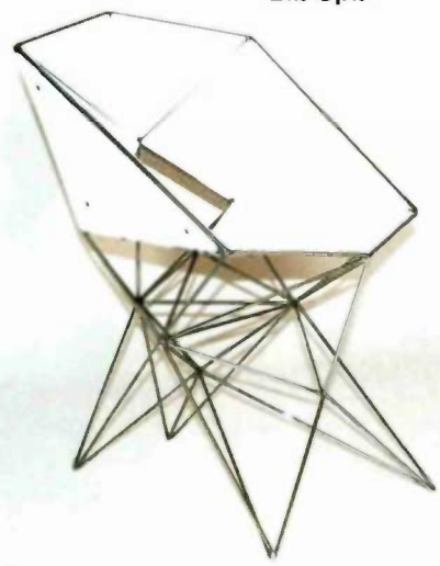
כיסא, דגם "מינימום מקסימום"

אבל מה עם הפונקציונליות? מספיק שתצבע מקרר בשני צבעים שונבים כדי שיקבל לוק של צעצוע. אני אוהב שהגבולות מיטשטשים. גם מכסחת דשא יכולה להיראות כמו צעצוע. הייתי רוצה למתג את הסטודיו שלי, "אסקו דיזיין סטודיו", כחברה שמתייחסת למושג עיצוב באופן ליברלי שיש בו פרשנות חופשית ורחבה. גם אייקונים של אדריכלות ועיצוב יכולים לשמש לך כיום השראה? כן, צ'ארלס ריי איימס הם השראה נהדרת. טום דיקסון נפלא בעיני בגלל המינימליזם והשימוש בחומרים ממוחזרים. מרטו גמפר יצר פרויקט מרתק של "100 כיסאות ב-100 ימים". הוא עיצב 100 כיסאות והציג אותם במוזיאון העיצוב בלונדון. צריך לראות כדי להאמין. זאת השראה!