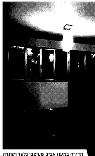
הדירה במעוז אביב שעיצבו גלעד וקונדה