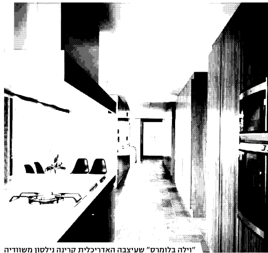
"וילה בלומרט" שעיצבה האדריכלית קרינה נילסון משוודיה