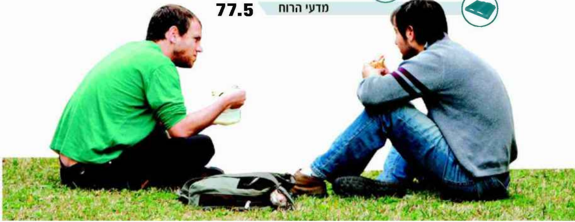
*באלפי שקלים בשנה