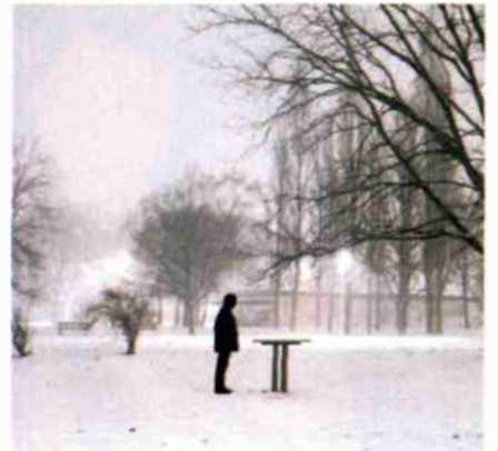
דפנה גרוסמן, רמת-גן