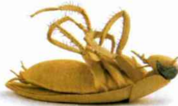
אווה אבידו, הביאנלה לקרמיקה, תל-אביב