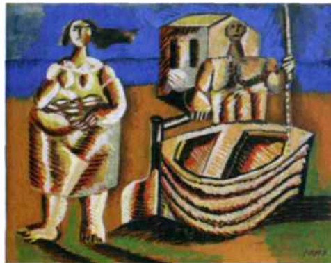
"הדיינ ואשתו", של אברהם אופק, חיפה