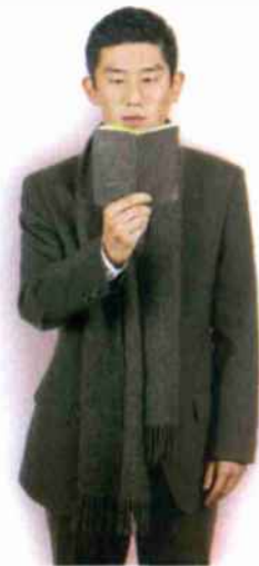
Obamas People, Eugene Kang של נדב קנדר, הרצליה