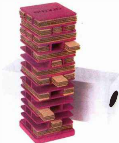
אחסון דקורטיבי לוופלים, מאת אדוה נח