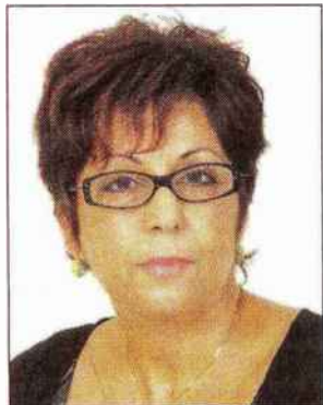
ומרגישה: "השכול הוא רבר נור" אי שהולך איתי כל יום, כל הי" ום, כל הזמן".