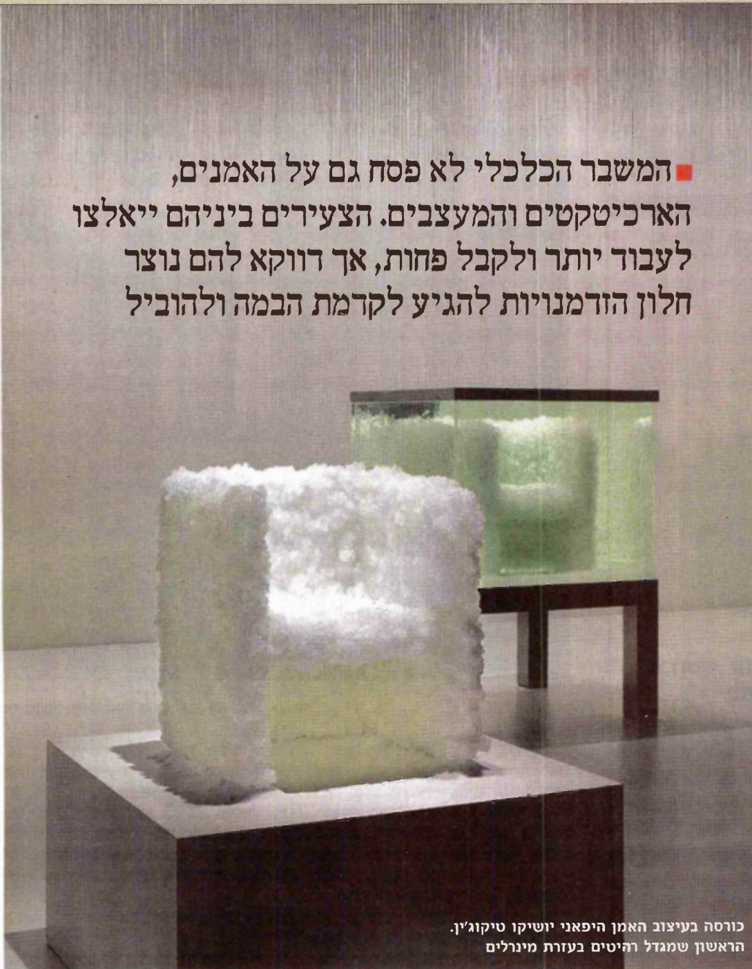
כורסה בעיצוב האמן היפאני יושיקו טיקוג'ין. הראשון שמגרל רהיטים בעזרת מינדרלים

■ המשבר הכלכלי לא פסח גם על האמנים, הארכיטקטים והמעצבים. הצעירים ביניהם יאלצו לעבוד יותר ולקבל פחות, אך רווקא להם נוצר חלון הזדמנויות להגיע לקדמת הבמה ולהוביל