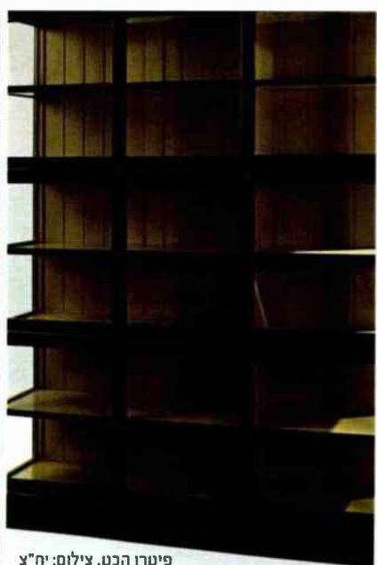
פיטרו הכט.