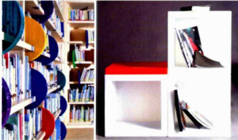
קמחי תאורה.