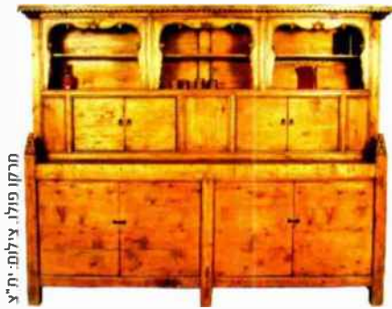
מרכז פולו.

הסגנון הנובורישי הצמיח הרבה "חמורים נושאי ספרים", שמחזיקים ספרים למטרות ייצוגיות בלבד. כך או אחרת, על מנת לאפשר לכל בית, גם אם הוא דירה עירונית קטנה, להחזיק ספרייה בין כתליו, קיים היום היצע מפתיע במגוון הרב שלו