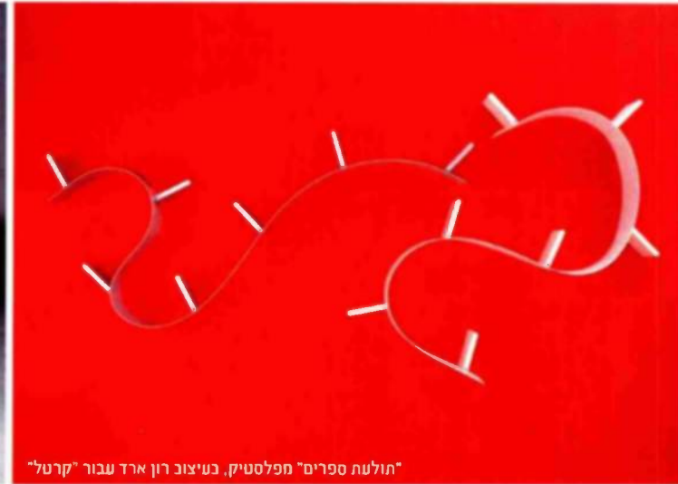
"תולעת ספרים" מפלסטיק, בעיצוב רון ארד עבור "קרטל"

ספריות בנויות, העשויות מגבס או מבלוקים ונטמעות בסביבה הבנויה באופן מרבי, היו נפוצות עד לפני כשנתיים, אך לאחרונה הועם זוהרן, ככל הנראה בשל הקיבעון שהן יוצרות בסביבה. ספריות פלסטיות פשוטות נפוצות כבר מספר שנים, אך לצדן מוצגות ממש לאחרונה ספריות מחומרים פלסטיים אולטרה-מתוחכמים כקוריאן