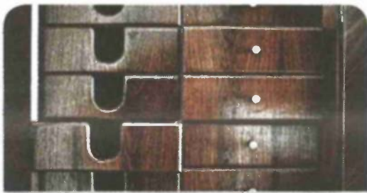
ארון מגירות אר דקו אמריקאי מעץ