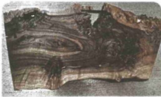
שולחן קפה בעיצוב ג'ורג' נקשימה משנות ה-80

"אני לא יכולה לראות חיבור בין המטבח לסלון, המקום שבו אתה מביא לידי ביטוי את האישיות שלך, המקום הכי מרכזי בבית. שם נעשית הבחירה הכי חשובה של הרהיטים. כתב היד שלך נמצא שם"