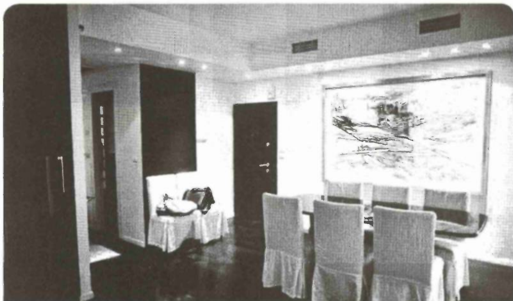
מבט מהסלון לעבר דלת הכניסה. ברקע ציור של פני יסעור

"אני לא יכולה לראות חיבור בין המטבח לסלון, המקום שבו אתה מביא לידי ביטוי את האישיות שלך, המקום הכי מרכזי בבית. שם נעשית הבחירה הכי חשובה של הרהיטים. כתב היד שלך נמצא שם"