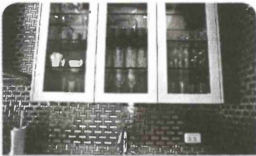
חיפוי נירוסטה במטבח