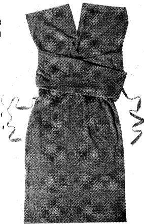
מרטין מרג'יאלה. קולקציית החורף