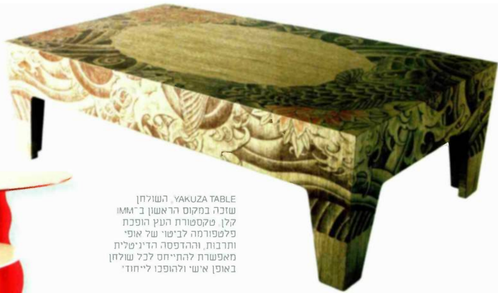
השולחן YAKUZA TABLE, השולחן שזכה במקום הראשון ב־IMM קלן, טקסטורת העץ הופכת פלטפורמה לביטוי של אופי ותרבות, וההדפסה הדיגיטלית מאפשרת להתייחס לכל שולחן באופן אישי ולהפכו לייחודי