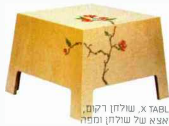
TABLE X, שולחן רקום, צאצא של שולחן ומפה