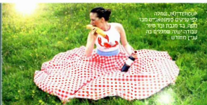
Buttercup, שמה לציפיקים ספונטאניים מוד מפה, בד מנבת ובו סינר. עבודה ישנה שמגלים בה עניין מחודש