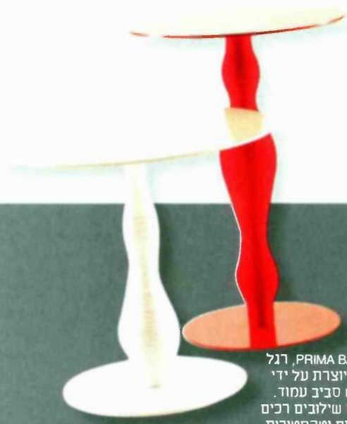
PRIMA BALLERINA, רגל השולחן מיוצרת על ידי ליפוף חוט סביב עמוד. כך נוצרים שילובים רכים של קימורים וטקסטורות, ומתאפשר ייצור אינסוף וריאציות של רגליים