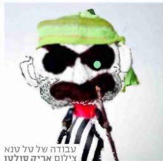
עבודה של טל טנא

פוני ואוסף אדיר של מיקי מאוס. כי האוספים הנדירים שבמקום אפשר למי צוא כאלו שנשמרו עוד משנות ה-50, ובהם בובות גומי חייכניות וצעצועי פישר פרייס. רובוטים, מכוניות, גיבורי רי על, צעצועי פח וצעצועי עץ רבים ממקמים להם בשלווה, אל מול עיניהם המשתאות של הילדים הצופים בהם. האוספים המוצגים הם רק חלק קטן ממה שקיים בכיתם של האספנים. מדובר כאלפי פריטים נדירים, שהוצאו לצורך התערוכה ויוחזרו בעוד כמה חודשים לביתם הטבעי.