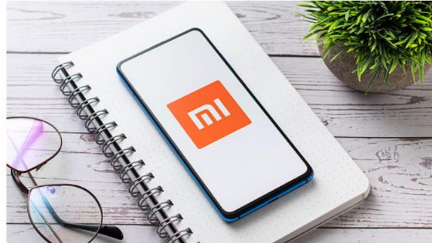
טלפון של חברת שיאומי

משרד ההגנה בליטא המליץ אתמול (שלישי) לצרכנים להימנע מרכישת טלפונים ניידים סיניים, והציע לאנשים שמחזיקים במכשיר מתוצרת סין לזרוק אותו לפח, לאחר שדוח ממשלתי מצא כי למכשירים הללו יש יכולות צנזורה מובנות.