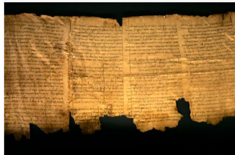
Sections of the ancient Dead Sea scrolls are seen on display at the Israel Museum in Jerusalem May 14, 2008.