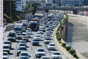
מקע חנוטה בנתיבי איילון, חל אביב. 'לחנודי את שטח הנחמ בדוריס'

מערכת ניהול התנועה פלקון, לצד האלגוריתם GoGreen, עושים שימוש בבינה מלאכותית כדי לנתב את התנועה וניהול הרמזורים ■ מנכ"ל אקסלרייט: "משפר את חוויית הנסיעה"