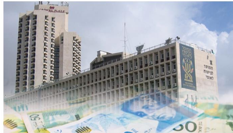
ביטוח לאומי