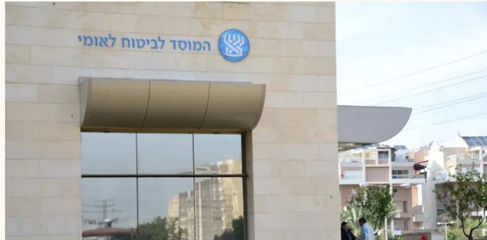
ביטוח לאומי ראשון לציון / צילום: תמר מצפי