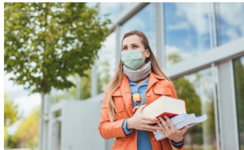
לא ייקן להגיד גם מילה טובה למגיפה ששינתה את פני האקדמיה