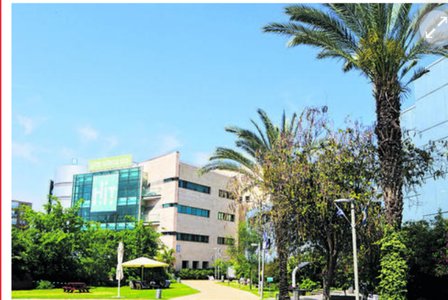
(המכון הטכנולוגי חולון)

גורמים במכון אומרים היום (ראשון) כי אישור זה מהווה הבעת אמון במכון ובאיכותו האקדמית. בקשת המכון לקבלת הסמכה זמנית להעניק באופן עצמאי דרגת פרופסור חבר עברה בדיקה בשתי וועדות ובמליאת המל"ג, ואושרה פה אחד בכולן.